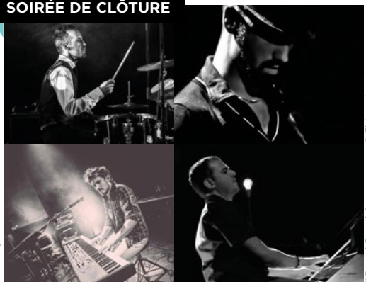
© Thierry Lousteneau © Pascal Derathé